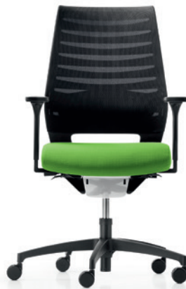
XC 53805 523 X-Code mesh (black edition)