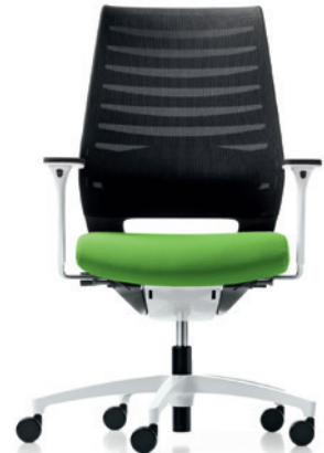
XC 53805 523 X-Code mesh (white edition)